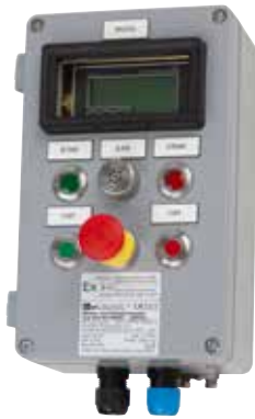
Not-Halt im Ex e/t Gehäuse Emergency Stop with Ex e/t enclosure