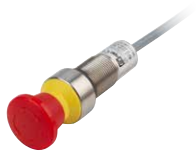
Not-Halt als Gerät verwendet Emergency Stop used as device

Der Not-Halt Typ AB1-N3 dient zum sicheren Abschalten von Maschinen und Anlagen in explosionsgefährdeten Bereichen der Zonen 1/2 und Zonen 21/22.